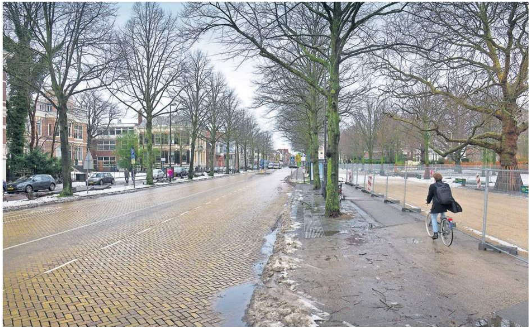
De Dreef, nu nog met klinkers.